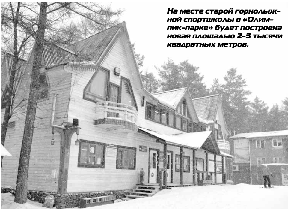
На месте старой горнолыжной спортшколы в «Олимпик-парке» будет построена новая площадь 2-3 тысячи квадратных метров.

Впрочем, если сам комплекс к 2013 году почти не видоизменится, вокруг него будут большие перемены. Совсем рядом с СОКом планируется построить велоцентр и проложить трассы для велосипедистов, чуть выше лыжных. А на берегу Белой откроется современный Центр пятиборья. Пока разрабатывается только его проект, но специалисты уверяют, что уже к июню они определятся со сроками начала строительства. Известно, что в проекте заявляются большой бассейн, а также манеж, где спортсмены могут упражняться в коньке.